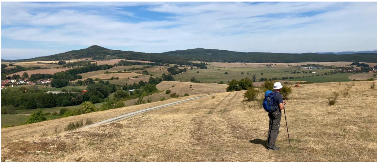
Blick vom Roßdorfer Hofberg auf Pleß und Stoffelskuppe