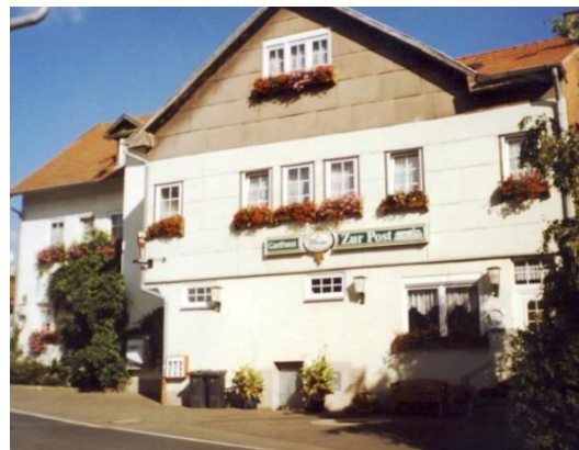
„Zur Post“ Hümpfershausen