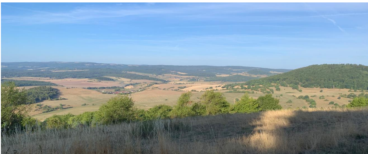
Blick von der Hohen Geba auf die Diesburg (rechts)